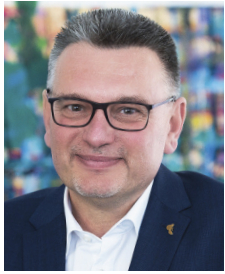
Norbert Zeidler Oberbürgermeister